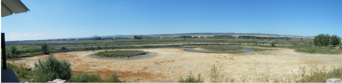
Panorámica del humedal.