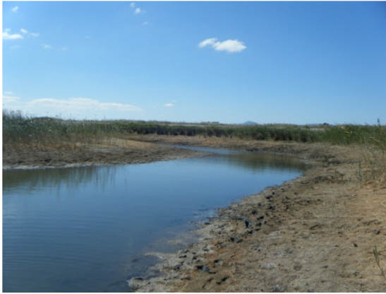
Detalle de la zona inundada.