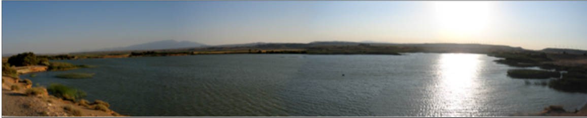
Panorámica de la laguna en 2007.