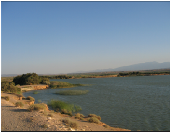
Imagen de la presa (foto de 2009)