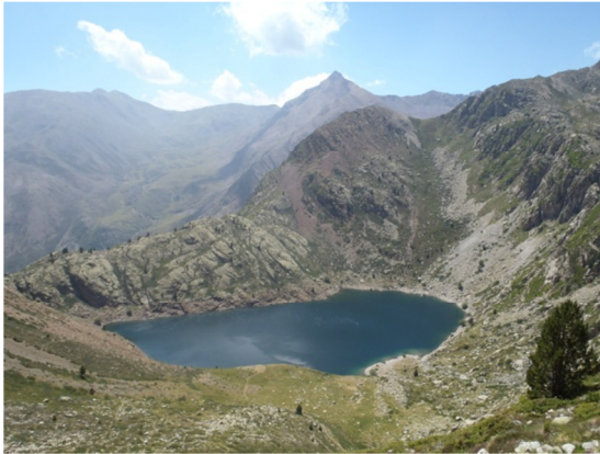
Vista general del lago.