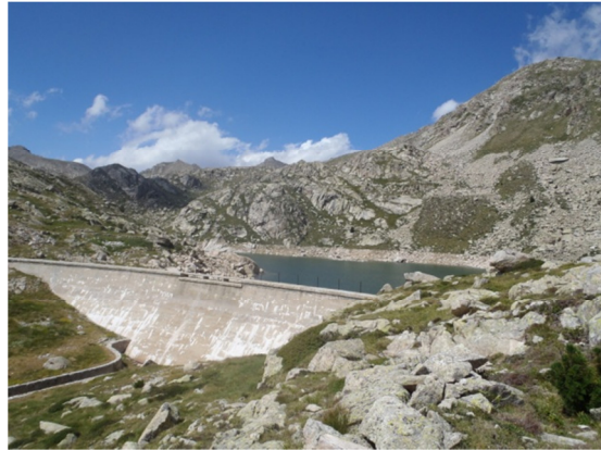
Vista de la presa.