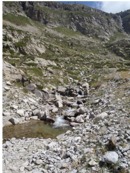
Curso de agua influente al lago.