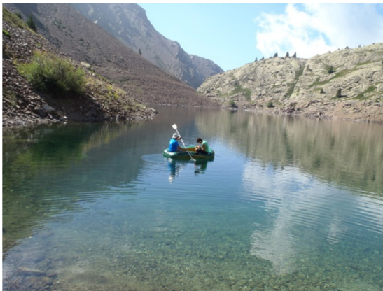
Muestreo en embarcación.