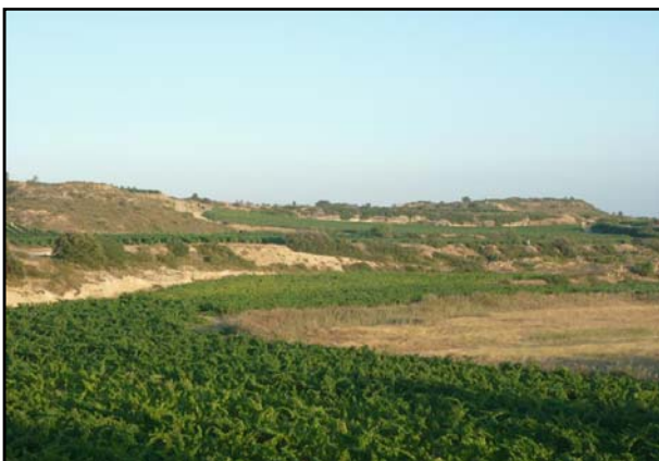
Imagen de los viñedos que rodean al lago