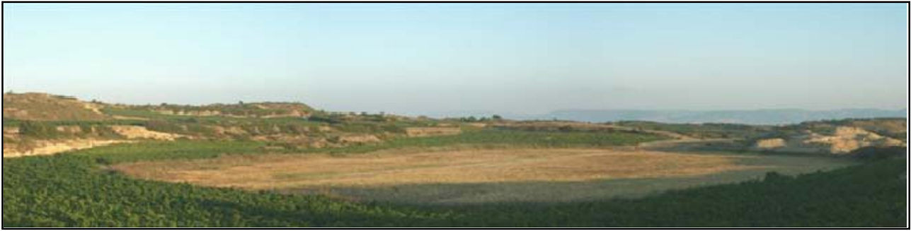
Vista del lago a finales de verano de 2009