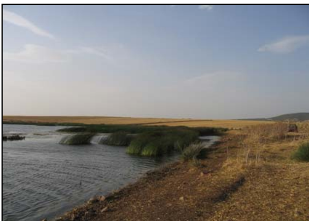
Campos de cereales alrededor de la laguna