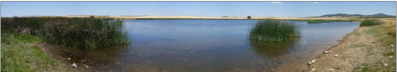
Vista del lago en 2009