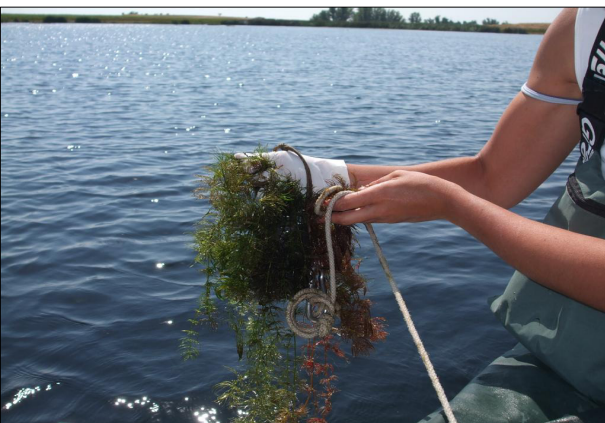
Ceratophyllum sp y Myriophyllum sp