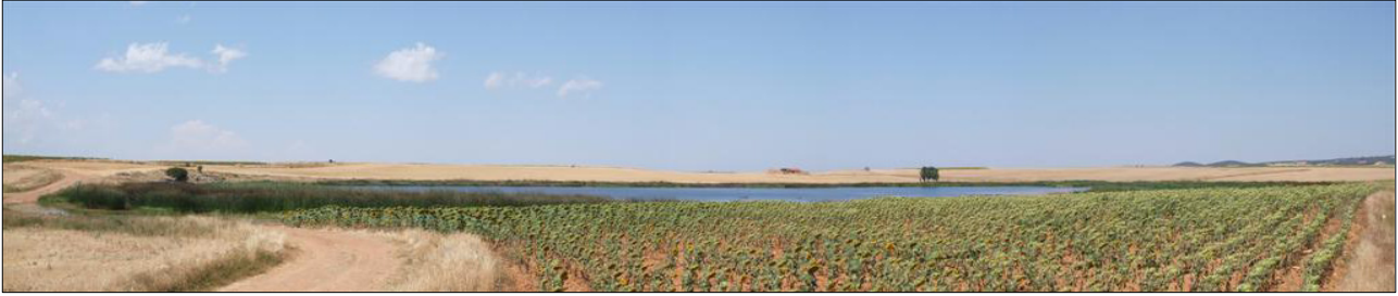
Vista del lago y de los campos de cultivo circundantes en 2008