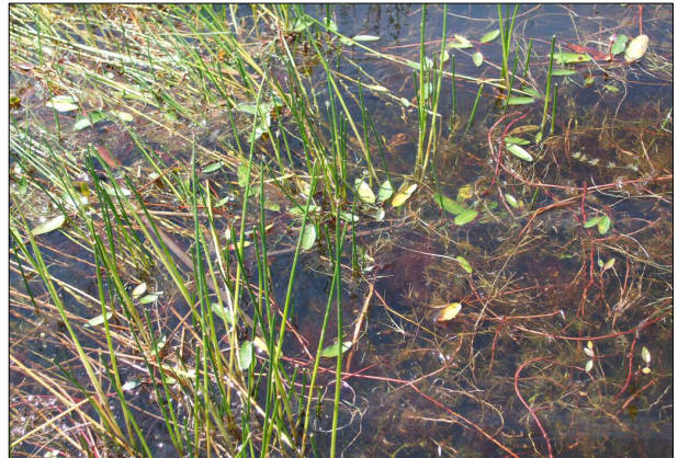
Polygonum amphibium , Ceratophyllum sp y Myriophyllum sp