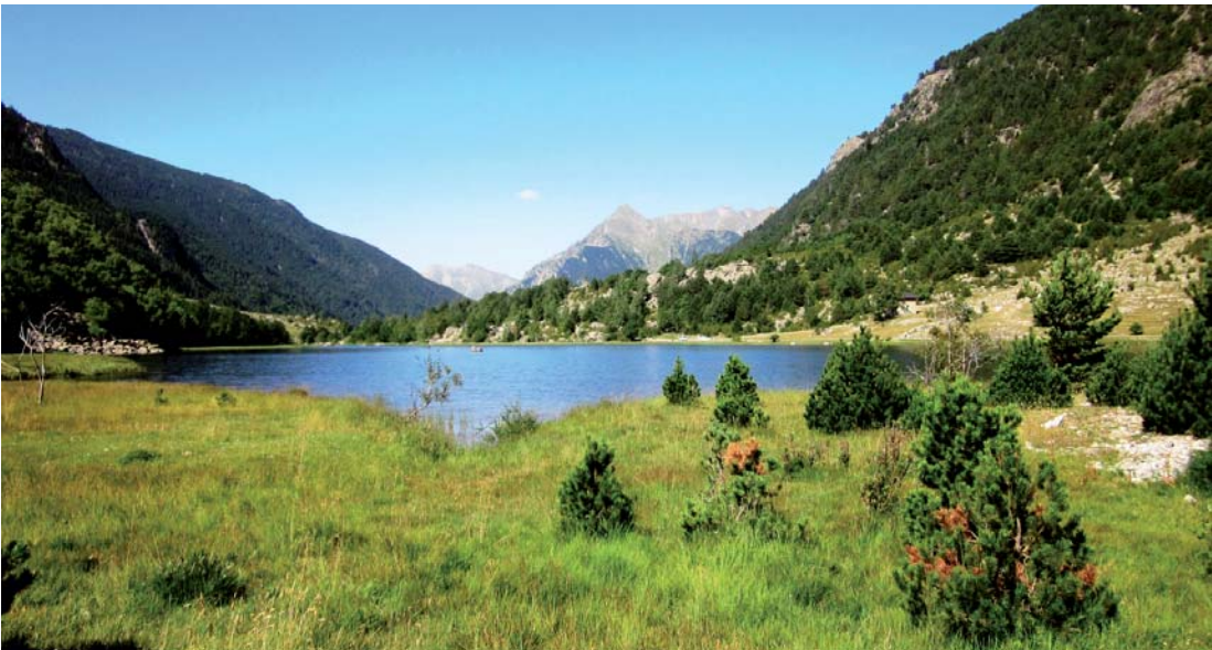
Estany de la Llebeta.

Aunque poco a poco se van concretando qué métricas son las más adecuadas para reflejar las alteraciones que se producen en estas masas de agua, todavía se trata de estudios pioneros. Unido a esto cabe destacar que en los lagos muy modificados o artificiales debe diagnosticarse el potencial ecológico en lugar de su estado. En este sentido todavía se está investigando y consensuando cuál es la metodología más adecuada para calcularlo, por eso hasta el momento en la cuenca del Ebro no se ha hecho ninguna diferenciación en la metodología, aunque debe entenderse que en el caso de las masas de agua muy modificadas o artificiales cuando el resultado de la clasificación del estado ecológico es muy bueno, en realidad debería decirse que su potencial ecológico es máximo.